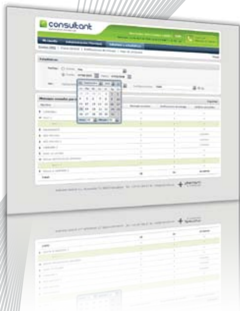
Ejemplo de la aplicación

Gestión de suscripciones de usuarios para el envío de información de valor añadido. Posibilidad de segmentar la suscripciones por categorías. Articulación de pasarelas NTTP para la integración con las aplicaciones de sus clientes. Los envíos pueden ser instantáneos o programados.